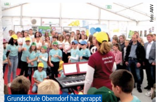
Grundschule Oberndorf hat gerappt

Die eingereichten Beiträge sind auf unserer Internetseite www.aww-nordschwaben.de zu sehen.