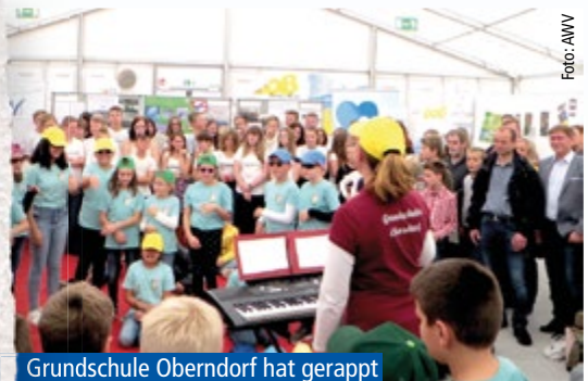
Grundschule Oberndorf hat gerappt

Die eingereichten Beiträge sind auf unserer Internetseite www.aww-nordschwaben.de zu sehen.